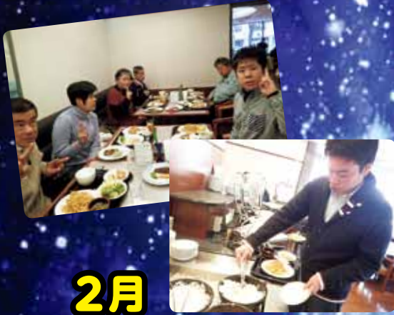
2月 ランチバイキング