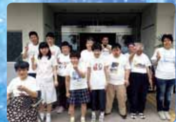
5月 高知県黒潮町 Tシャツアート展参加